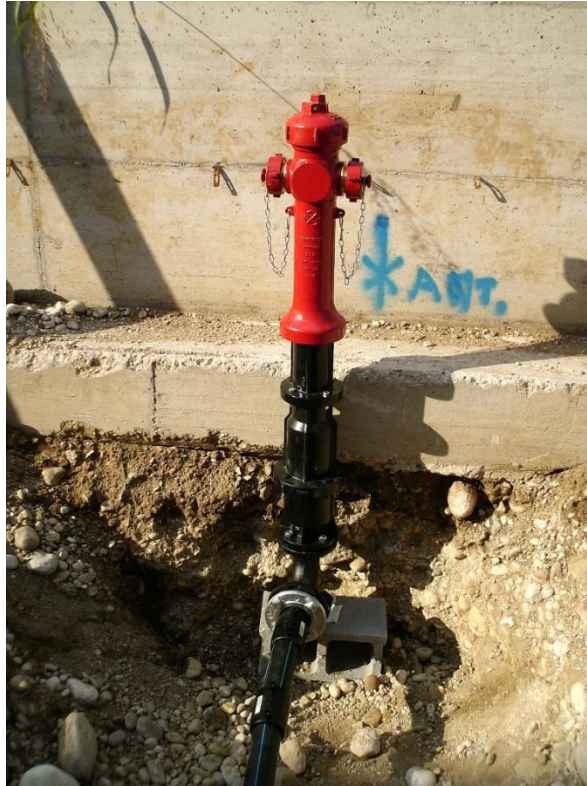
TNT Centro smistamento – sede Verona: realizzazione impianto antincendio