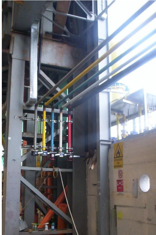
Fincantieri – Monfalcone (GO): realizzazione impianti di distribuzione gas industriali