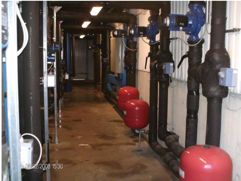
De Longhi - Treviso – celle di prova per gruppi frigoriferi