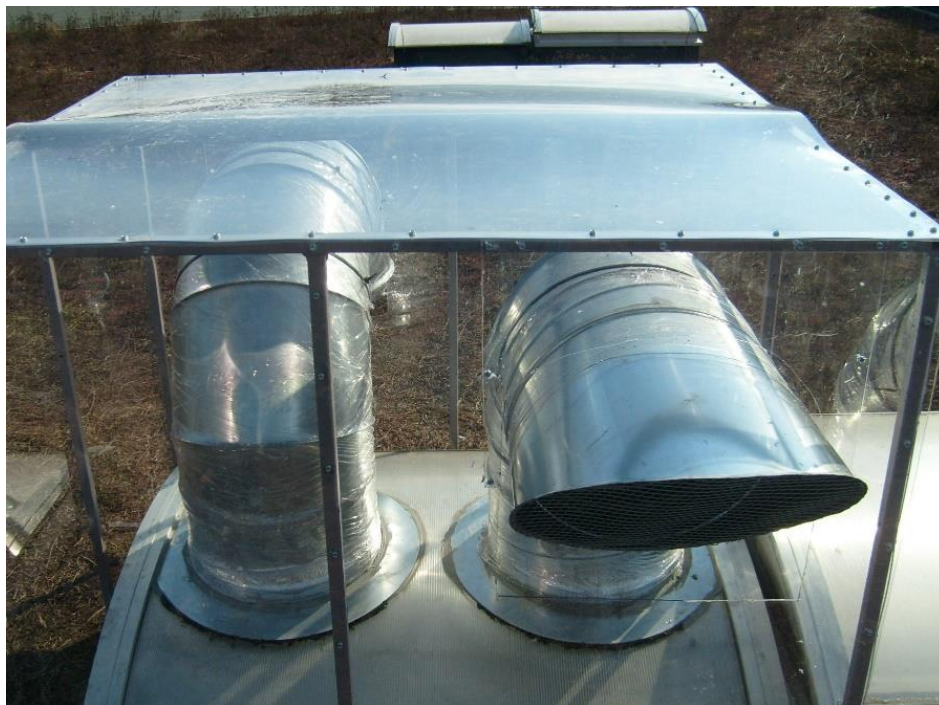
Punto vendita Unieuro – Belluno: realizzazione impianto riscaldamento/raffrescamento VRV e ricambio aria