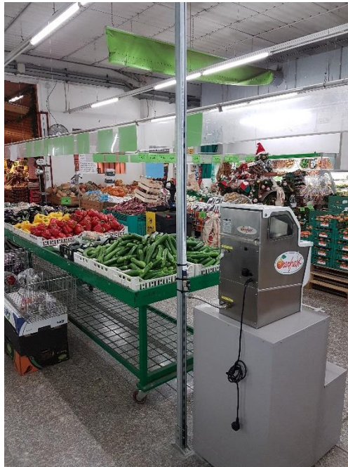
Supermercato SA.MA. Frutta – S. Pietro In Cariano (VR): manutenzioni impianti e celle frigorifere