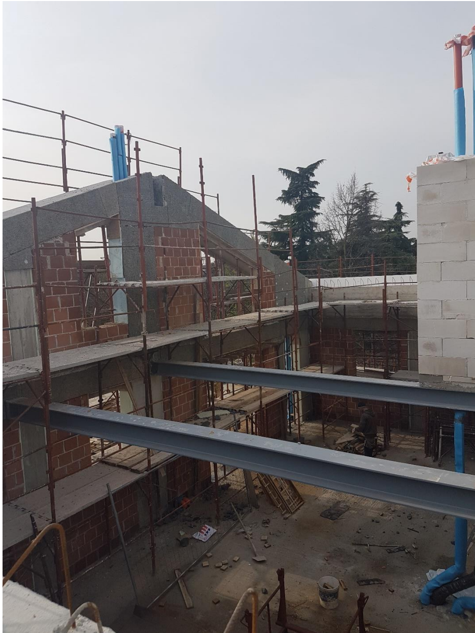
Residence Margherita – Verona: realizzazione di impianti su struttura di nuova costruzione (impianti con sistema ibrido caldaia / pompa di calore)