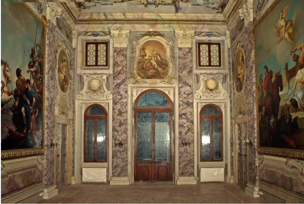
Palazzo Paletta Dai Prè - Verona: sala ricevimenti al piano nobile installazione di impianto di riscaldamento e raffrescamento (impianto a ventilconvettori)